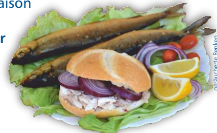
geräucherte Renken und Fischsemmel (Symbolbild)

Also schauen Sie doch gerne mal in Utting vorbei – am Fischverkauf in der Seestraße 17, unterm Sonnenschirm am Bootsverleih, auf dem Steg oder auch schon im Februar an unserem Stand auf der Messe f.re.e in München!